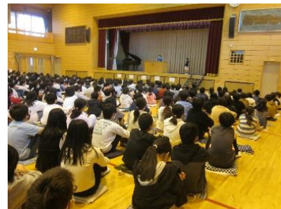
決意を新たに始業式

始業式では、代表児童が新しい学年になってがんばりたいことや楽しみなことを発表しました。3年生の代表児童は、「英語や理科の授業が楽しみです。」と発表しました。また、6年生の代表児童は、「自主学習