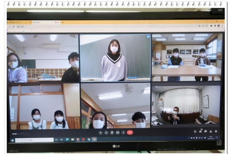
【校長室のパソコン画面】

スローガンに本県の方言「こびっと」が採用されていました。『しっかり』という気持ちを強調するために、また覚えやすいフレーズにしたいという思いからでしょうか、親しみやすい甲州弁が使われています。そして、この3つのテーマは、学校の教育目標「やさしく かしこく たくましく」につながっているようです。