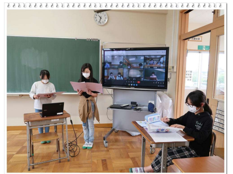
【オンライン会場/児童会室】

私たち教職員と児童会(全校児童)が一つになって、やさしく、かしこく、たくましい、そんな子どもたちが集う貢川小学校をめざして取り組んでいこうと、私自身、気持ちを新たにしました。児童会の子どもたちに、勇気づけられたような気持ちになりました。みんなで、「こびっと」やっていきましょう！！